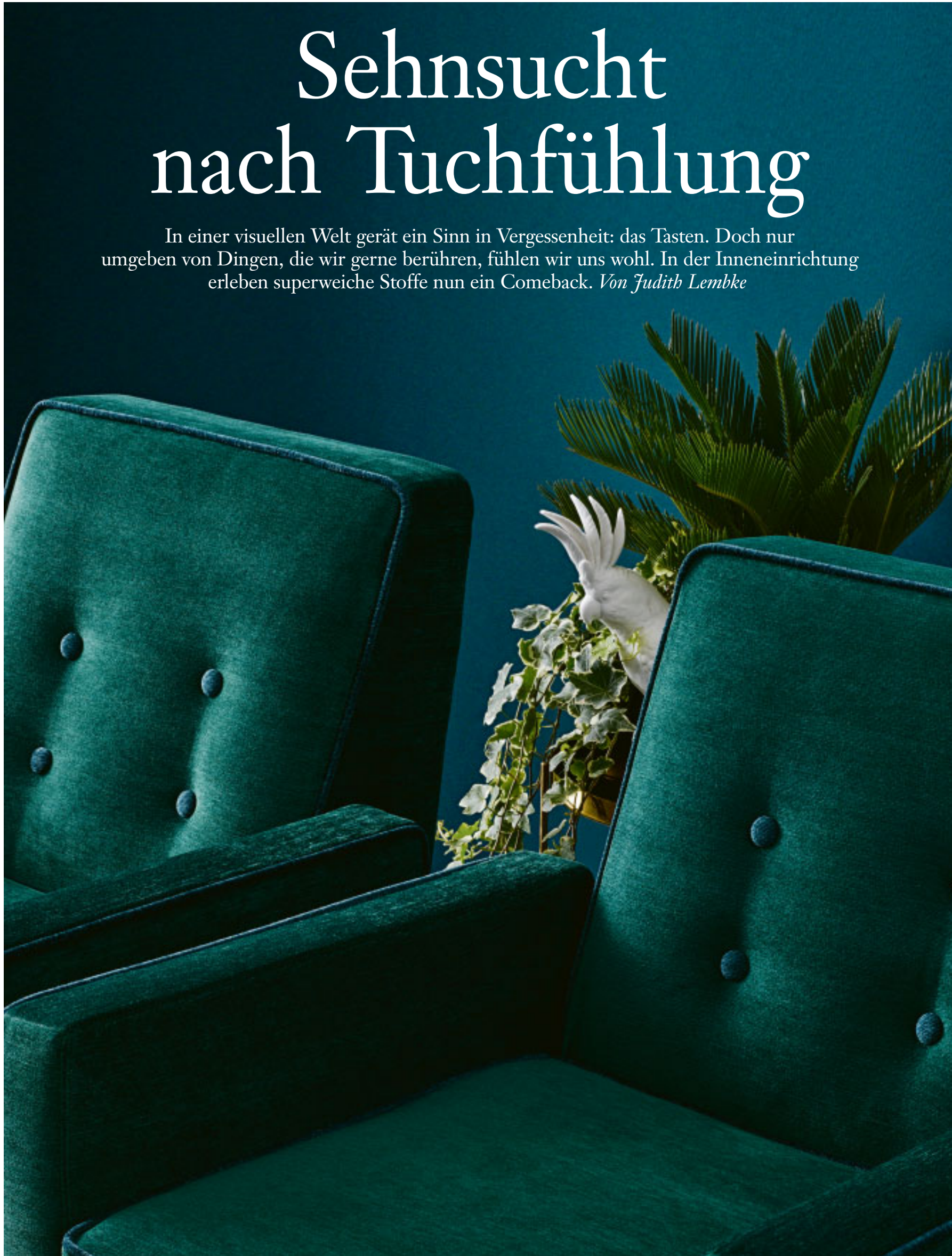
Wer gut sitzt, verweilt länger: Sessel „Duke“ von Sahco Hesselein

In einer visuellen Welt gerät ein Sinn in Vergessenheit: das Tasten. Doch nur umgeben von Dingen, die wir gerne berühren, fühlen wir uns wohl. In der Inneneinrichtung erleben superweiche Stoffe nun ein Comeback. Von Judith Lembke