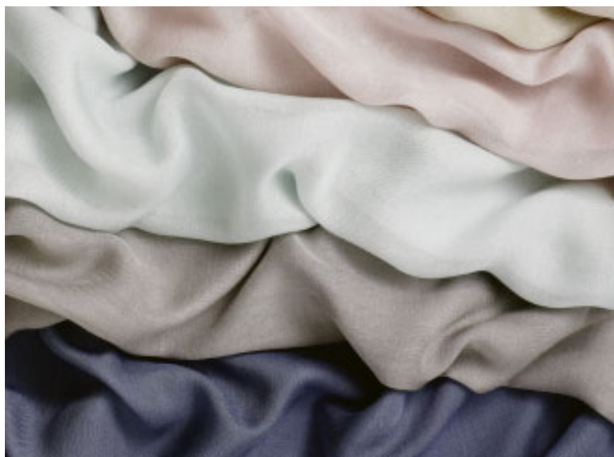
Weich wie ein Schal: Vorhangstoff „Pashmina“