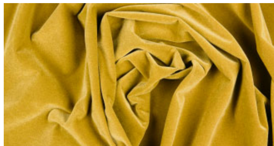
Samtig wie ein Pfirsich: Bezugsstoff „Infinity Plus“