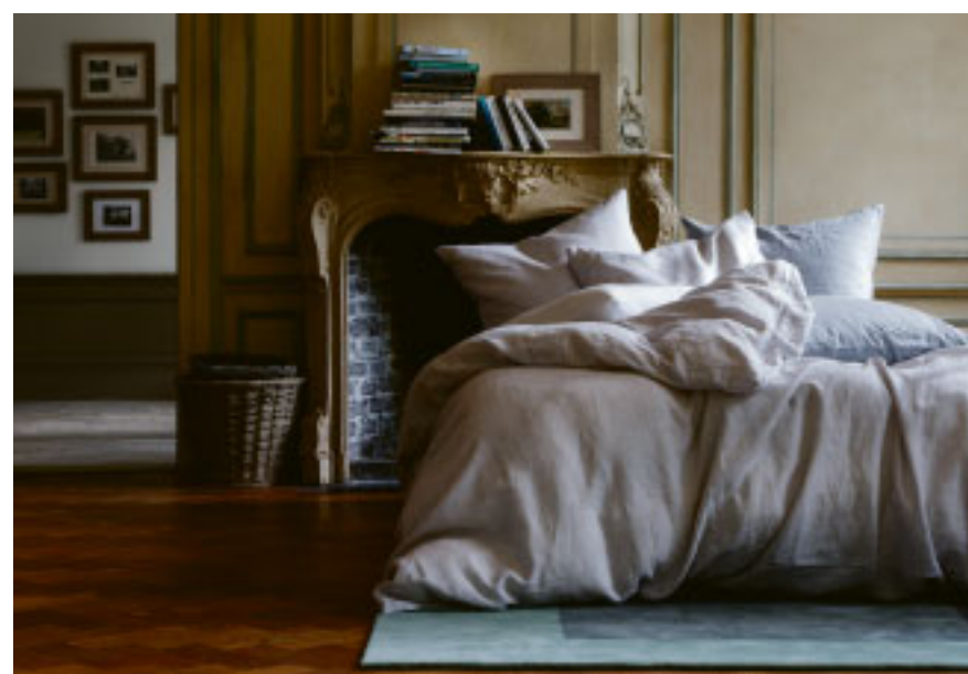
Haptik im Schlaf: Glatte Baumwolle kühlt den Körper.